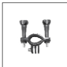
Крепление на велосипед