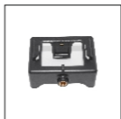
Кронштейн для камеры