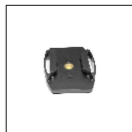
Крепление на шлем