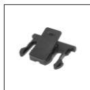
Крепление на пояс