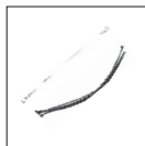
Хомуты и трос