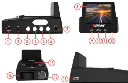
СХЕМА КОМБИНИРОВАННОГО УСТРОЙСТВА ARTWAY .....