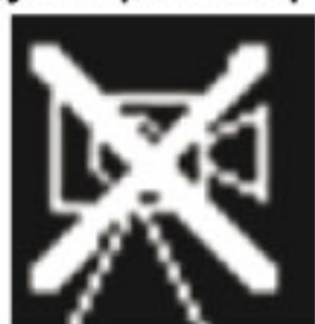
Оповещение о муляже радара Стрелка-СТ