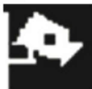
Оповещение о «малозумном» радаре