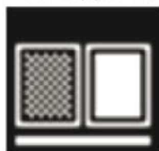
Оповещение о стационарном радаре Стрелка-СТ

Визуальные оповещения о всех видах объектов, содержащихся в базе координат выглядят следующим образом: