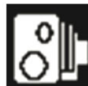
Оповещение о системе видеофиксации, вкл. «ПОТОК»