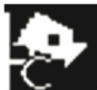
Оповещение о секционных камерах, типа «Автодория»: Старт