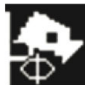
Оповещение о секционных камерах, типа «Автодория»: Финиш