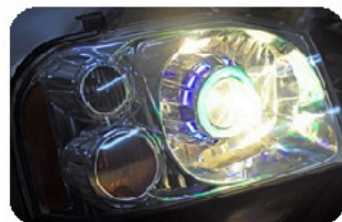
8. Настройте пучок света. Также проверьте яркость «ангельских глаз» и отсутствие мерцания.