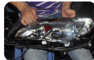
3. Разберите фару с помощью отвертки либо другого подходящего инструмента.