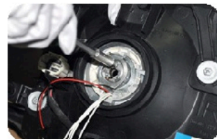
6. Соедините пластиковые коннекторы.