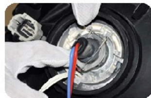
7. Вставьте лампу H1 в рефлектор и закрепите с помощью пружины.