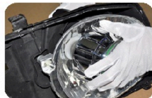
4. Осторожно установите линзу в фару. Закрепите фиксирующее кольцо.