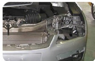
1. Откройте автомобиль и снимите фару.