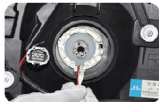
5. Закрепите линзу с помощью гайки.