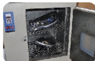
2. Поместите фару в специальную печь для того, чтобы ее проще было разобрать.